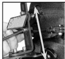
Aktivt pandebånd (5a)